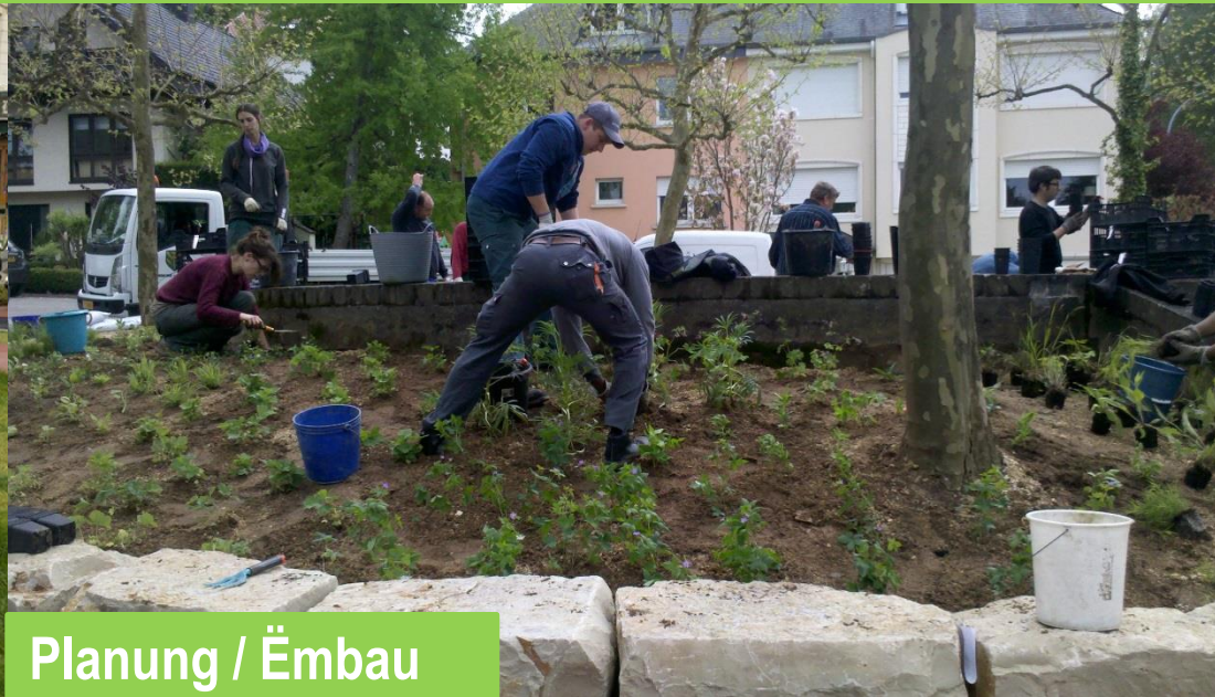
Planung / Ëmbau