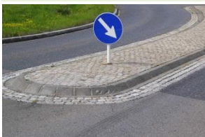
Abb. 8 Bei Verkehrsinfrastrukturen geht die Sicherheit vor! Doch ein dementsprechend sicherer Verkehrsraum mit ausreichenden Sichtfeldern wird nicht notgedrungen mit einer plastisch sterilen Gestaltung der Verkehrswege erreicht.