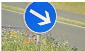
Abb. 4 Ohne Sichtbarrieren lassen sich naturnahe Vegetationsstrukturen in Straßenbankette und Randbereiche integrieren. Diese können durch ihren einfachen Unterhalt und ihre farbenfrohe Artenvielfalt bestechen.