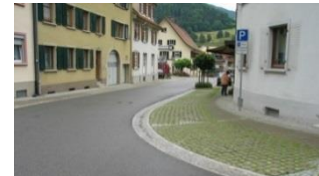
Abb. 6 Gesteuerte Straße und Stellplätze mit begrüntem Fugenpflaster. Fließende Übergänge durch den systematischen Verzicht auf Bordsteinkanten. Die Begrünung wurde bereits bei der Planung angedacht und kann abgemäht werden.