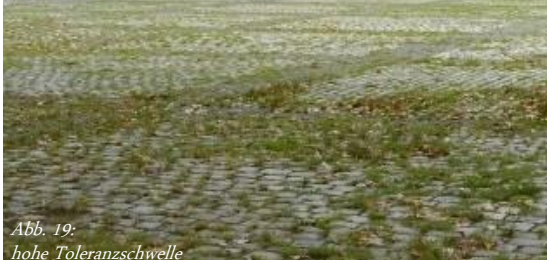
Abb. 19: hohe Toleranzschwelle