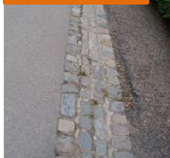
Abb. 14: niedrige Toleranzschwelle