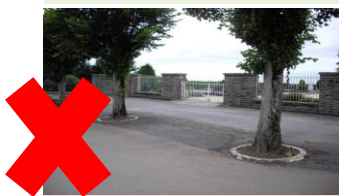
Abb. 7 Versiegelten Flächen wird nachgesagt, dass sich der Aufwand für deren Unterhalt auf ein Minimum reduziert. Häufig geht diese Praxis jedoch auf Kosten der Ästhetik und der Umwelt und ist mit einem hohen Aufwand verbunden, um das Ableiten von Niederschlägen zu gewährleisten.