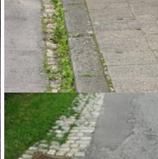
Abb. 15: mittlere Toleranzschwelle