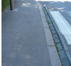
Abb. 11: niedrige Toleranzschwelle