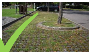
Abb. 3 Befestigte Flächen müssen nicht versiegelt sein. Eine bewusster Auswahl von wasser-durchlässigen Baumaterialien ermöglicht je nach Nutzungs-anforderung eine „natürlichere“ Gestaltung.

Im Folgenden wird dokumentiert, wie man mit der gesetzlich verlangten Umstellung auf pflanzenschutzmittelfreie öffentliche Flächen umgehen bzw. möglichen Problemen vorbeugen kann und welche Behandlungsarten sich für den Unterhalt befestigter Straßen, Wege und Plätze anbieten. Außerdem bieten Good-Practice-Beispiele konkrete Ansatzmöglichkeiten.