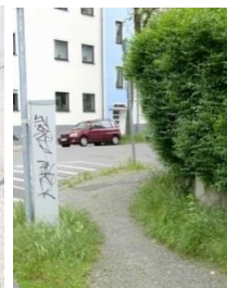
Abb. 13: hohe Toleranzschwelle

Festlegen der Toleranzschwelle. Ab welcher Bewuchsdichte und -höhe soll eingegriffen werden?