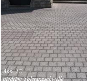
Abb. 17: niedrige Toleranzschwelle