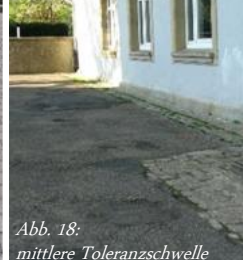
Abb. 18: mittlere Toleranzschwelle