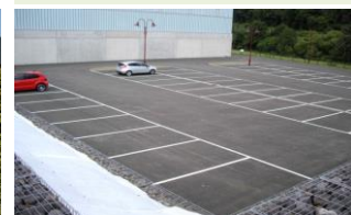
Abb. 10 Bautechnische Kriterien und Normen werden bei der Planung mit höchster Priorität behandelt. Dabei geraten ästhetische Aspekte meist ins Hintertreffen. Möglichkeiten zur Begrünung werden oft lediglich als „Lückenfüller“ erst bei der Ausführung von Bauprojekten thematisiert.