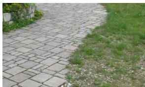
Abb. 5 Fließende Übergänge erhöhen nicht nur den Nutzerkomfort, sie schaffen Raum für kontrollierten Pflanzenwuchs, lassen Niederschlag vor Ort im Boden versickern, und reduzieren den Pflegeaufwand,