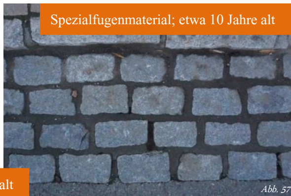
Spezialfugenmaterial; etwa 10 Jahre alt