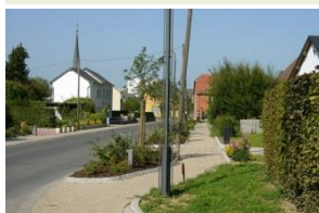
Abb. 9 Die strikte Unterteilung von Straßen, Gehwegen und Blumenbeten reduziert nicht nur die Aufenthaltsqualität (für Fußgänger), sondern drückt auch die Toleranzgrenze für Spontanvegetation nach unten und steigert den Arbeitsaufwand maßgeblich.