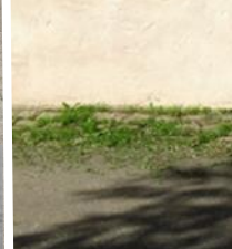
Abb. 16: hohe Toleranzschwelle