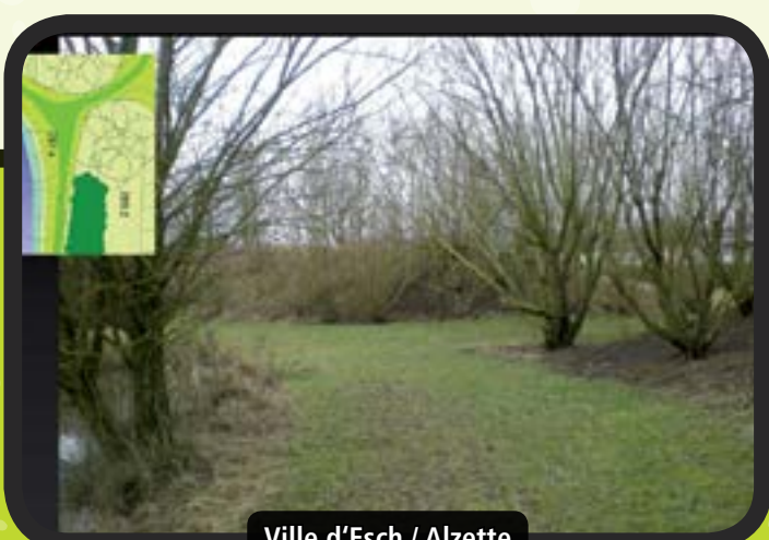
Ville d'Esch / Alzette