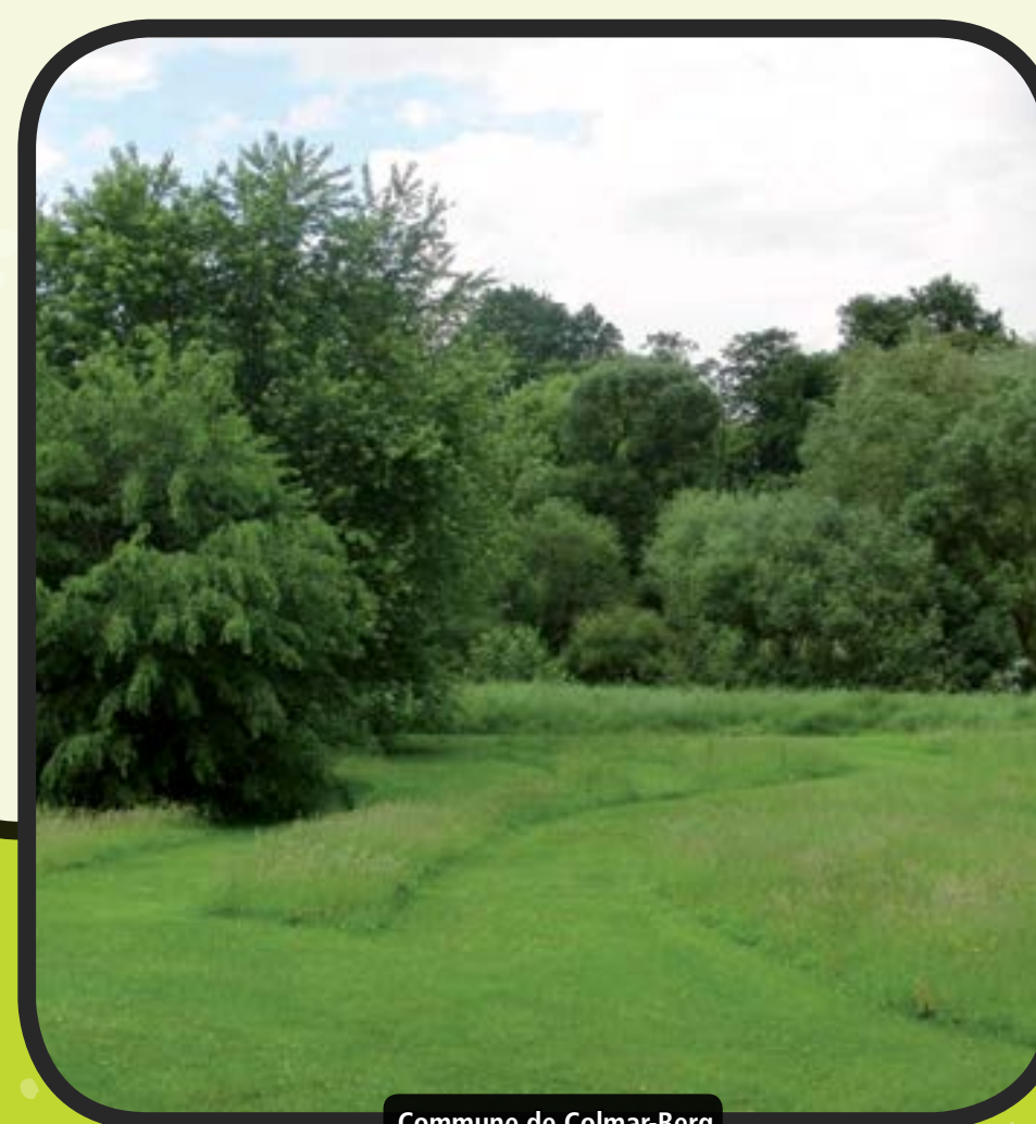
Commune de Colmar-Berg