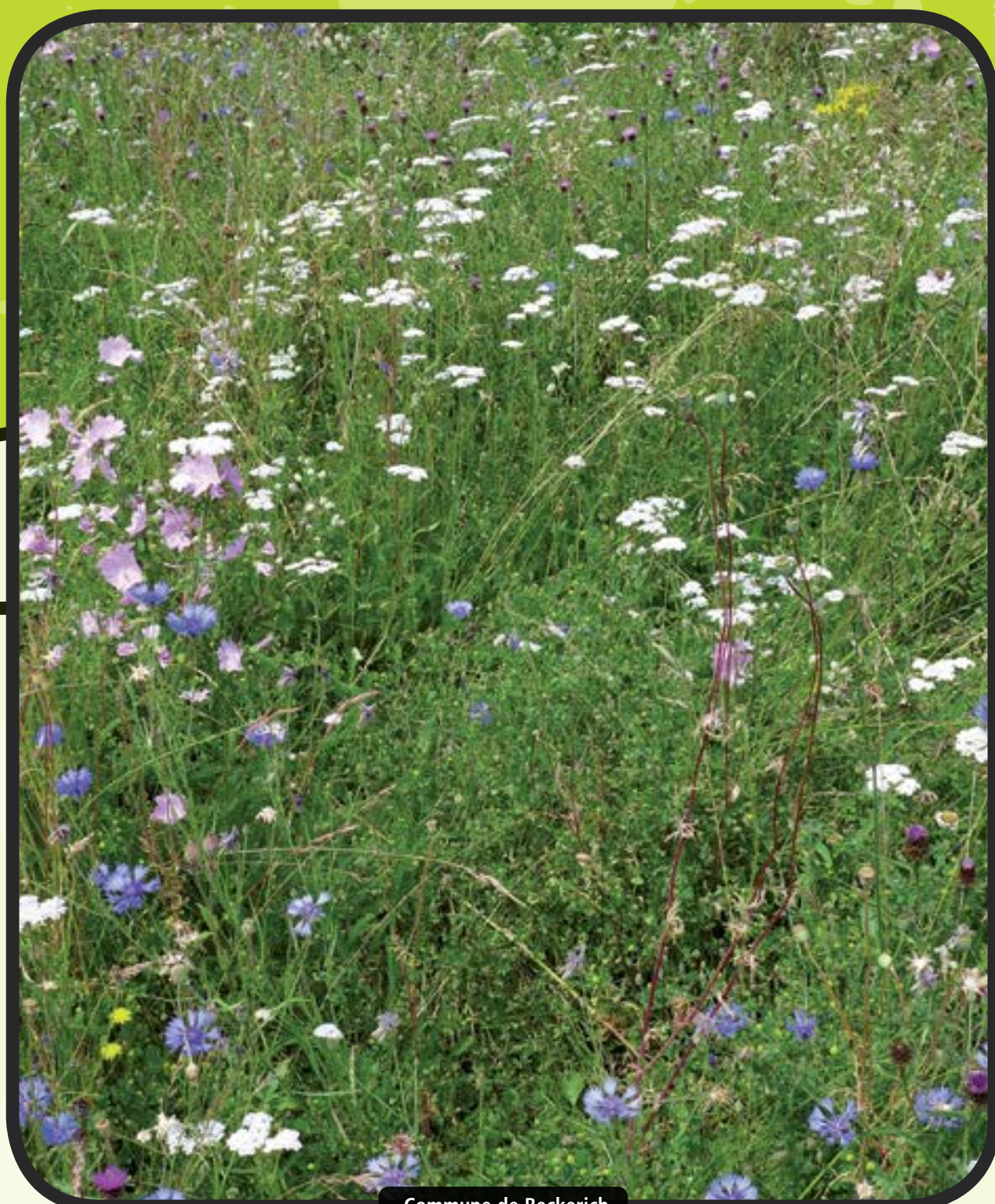
Commune de Beckerich