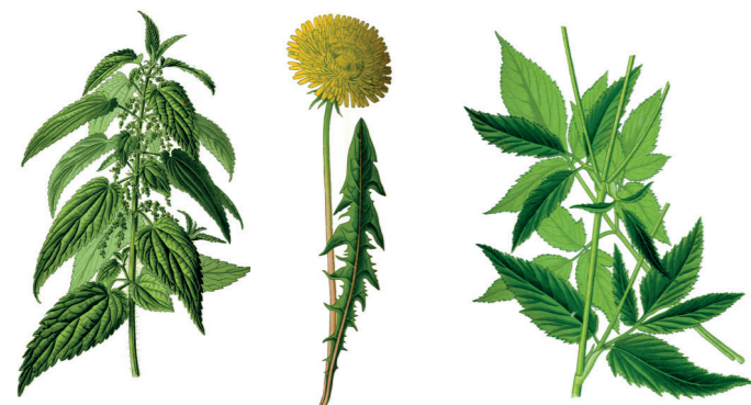
Schmackhafte Wildkräuter – zum Beispiel: Brennnessel · Löwenzahn · Giersch

Giersch war im Mittelalter bei den Mönchen sehr geschätzt. Als Gemüse und „Zipperleinskraut“ wurde er in Kloostergärten angebaut.