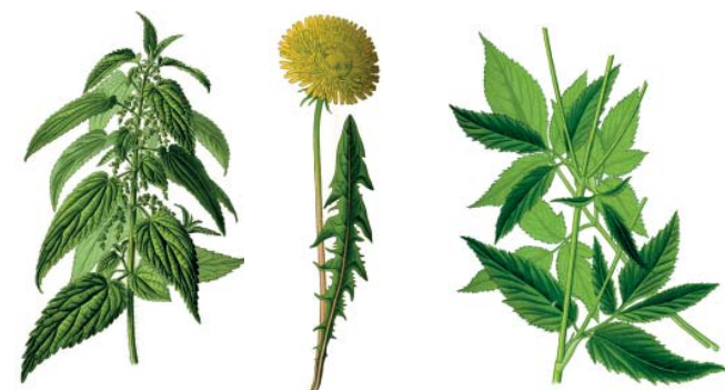
Herbes sauvages délicieuses – par exemple: Ortie – Pissenlit – Herbe aux goutteux

Roulade de tussilage, salade de pissenlit, crème de truite à l'herbe aux goutteux, mayonnaise d'oseille, épinards d'orties, limonade à l'égopode podagraire, quiche aux herbes sauvages, fromage blanc à la pimprenelle, gratin d'arroche.